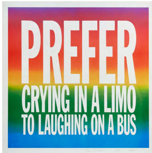
John Giorno, PREFER CRYING IN A LIMO TO LAUGHING ON A BUS, 2017 Archival Pigment print, 66 x 66 cm Édition de 75 (JGIOR0014) Édité par Cahiers d'Art 750€